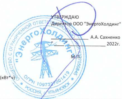
ГРАФИК ограничения режима потребления электрической энергии (кВт*ч) на период с 01.10.2022 по 30.09.2023 по ООО "ЭнергоХолдинг"